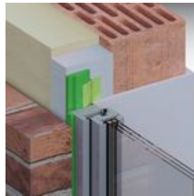
Lösungsmöglichkeit: ME350 Fensterfolie Innen VV FM230 Fensterschaum+ TP600 illmod 600